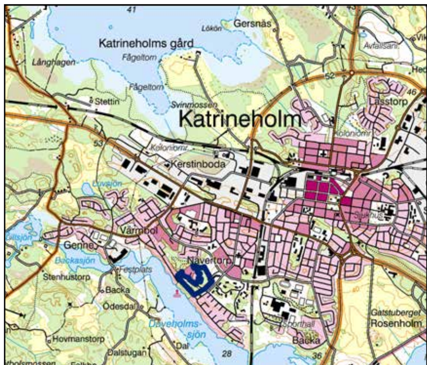
Fig. 2. Utredningsområdet, se blå markering, ligger i södra kanten av Katrineholm, invid Duveholmsjön. Utdrag ur topografiska kartan, skala 1:50 000.

Den arkeologiska utredningens syfte var att lokalisera och fastställa fornlämningar. I utredningen ingick att dokumentera och redovisa övriga kulturhistoriska lämningar samt att lyfta fram möjliga fornlämningar, företrädesvis tänkbara lägen för förhistoriska boplatser och att pröva dessa genom utredningsgrävningar.