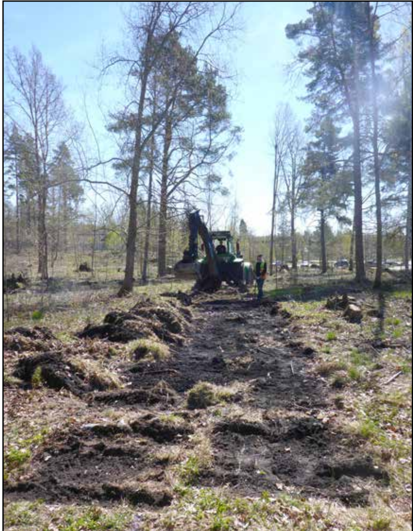
Fig. 6. Inom objekt 3 i schakt 1 påträffades rester av en majbrasa, objekt 7 . På bilden syns hur schaktet lagts tvärsöver majbrasan som inte kunde skönjas innan avtorvning.

I ett schakt framkom ett tjockt lager med sot och kol som först tolkades som en kolmila. men genom studie av kolmaterialet och en avgränsning av området genom provstick i området visade det sig att lämningen var mycket oregelbunden och med ett kolmaterial som inte hade några likheter med materialet i kolmilor. Kolet var varierat från små pinnar till tjocka grenar och även någon plank! Lämningen fick sin förklaring när en boende i området kom på besök och kunde berätta att det var rester av baptisternas majbrasa som vi grävde i.