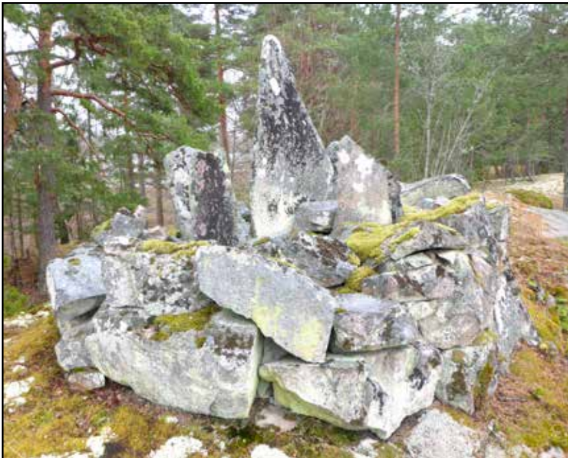
Fig. 1. Objekt 1, ett femstenarör på krönet av ett högt berg sett från sydväst.

Gränsröset klassas som en övrig kulturhistorisk lämning och har genom sin karaktär stora kulturhistoriska värden och bör värnas. Majbrasan och röjningsröset är övriga kulturhistoriska lämningar från sen tid och kräver ingen åtgärd.