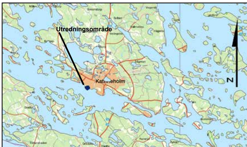
Fig. 3. För 7 000 år sedan låg utredningsområdet invid en forntida fjärd. Katrineholms-trakten var då ett skärgårdslandskap. Utdrag ur fastighetskartan. Skala 1:250 000.

Området ligger på nivåer mellan 40 och 50 meter över havet. Det innebär att de högsta bergstopparna i området torrlades under senare delen av av äldre stenålder då området var en flikig skärgård. I närliggande delar av Katrineholms trakten har det påträffats ett stort antal boplatser från både äldre och yngre stenålder. Flera av dessa ligger på nivåer mellan 40 och 50 meter över havet. Här ska tilläggas att det rör sig om boplatser som varit strandbundna men också om yngre boplatser som legat på avstånd från stranden.