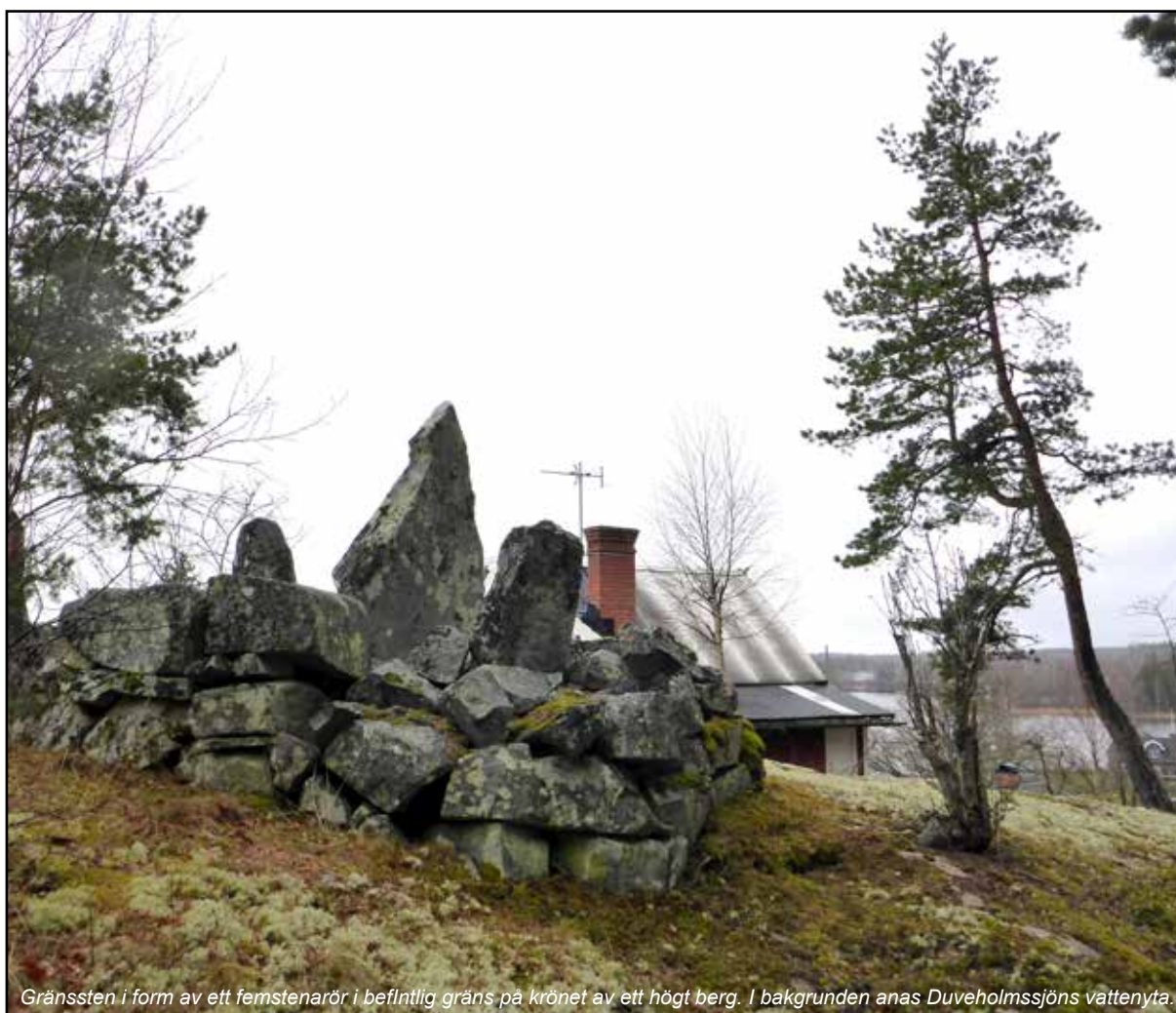
Gränssten i form av ett femstenarör i befintlig gräns på krönet av ett högt berg. I bakgrunden anas Duveholmssjöns vattenyta..