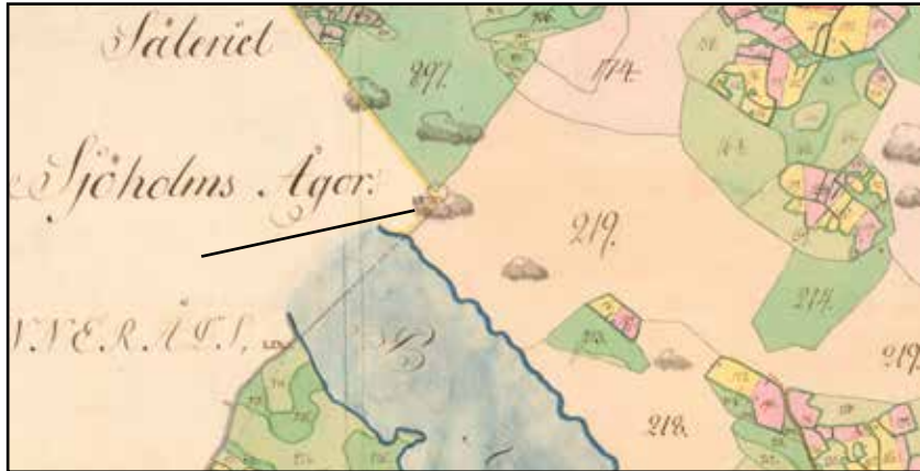
Fig. 4. Vid fastighetsgränsens hörn, se markering, står det på kartan från 1799 "LXVIII". I akten beskrivs LXVIII som "En 5 Stena Stav i rösa Stående uti gårdslegården emellan Hemmanen Ödesdahl och Dahlsängan, Öster om Ödesdahl och Norr om Dahl. Hjerstenen 1,1/3 qv. lång 1/2 aln bred mittuppå....."

Området har varit utmark ända in på 1900-talet då det anlades ett sommarstugeområde och en badplats vid sjön. På 1950-talets ekonomiska karta syns ytterligare några hus, inom utredningsområdet. Enligt uppgift användes de av Katrineholms baptistförsamling.